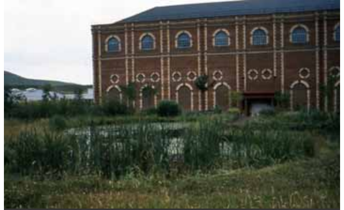
工場敷地内で環境教育に活用されているビオトープ（英国）