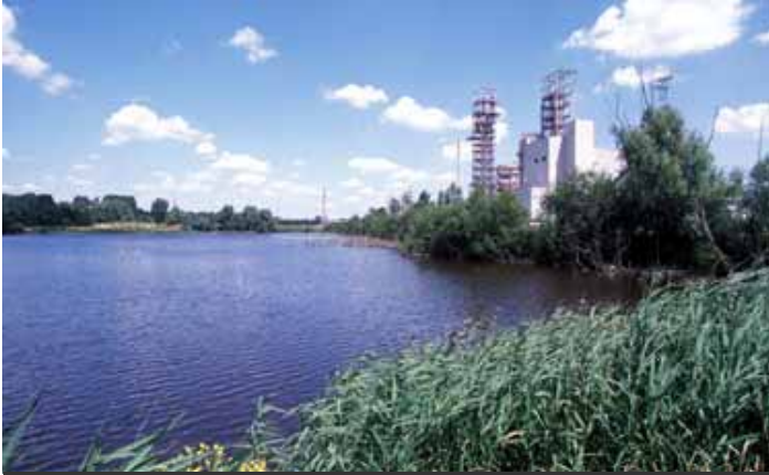
鳥や魚など多様な種が生息するプラントの緑地（ベルギー）